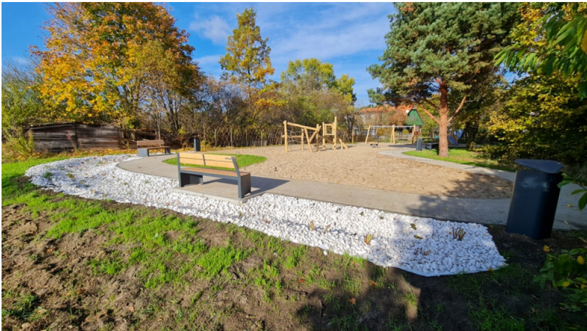
Teren częściowo zagospodarowany

Zamówienie nr 143/BZP-PU.511.131.2024/MN BZP-PU/137/2024/MN