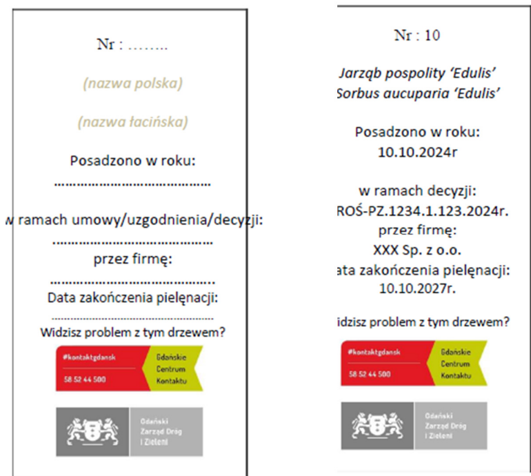
Fot. nr 1 – zdjęcie poglądowe oznakowania nasadzeń

Na tabliczce należy również umieścić nr porządkowy drzewa lub oznaczenie zgodne z dokumentacją projektową